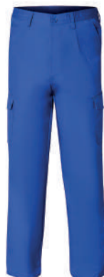
Pantalón trabajo azul