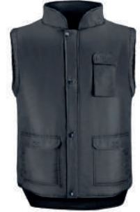
Chaleco multibolsillos negro