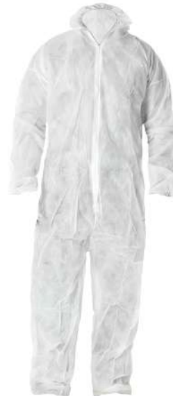
Buzo monouso polipropileno

Talla L: CÓD. 15020730 Talla XL: CÓD. 15020735 Talla XXL: CÓD. 15020740