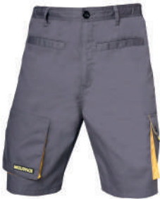
Pantalón trabajo gris / amarillo corto

Talla S: CÓD. 15017117 Talla M: CÓD. 15017118 Talla L: CÓD. 15017120 Talla XL: CÓD. 15017125 Talla XXL: CÓD. 15017130