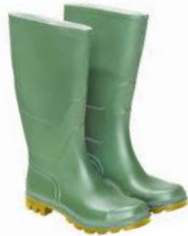
Botas goma altas verdes