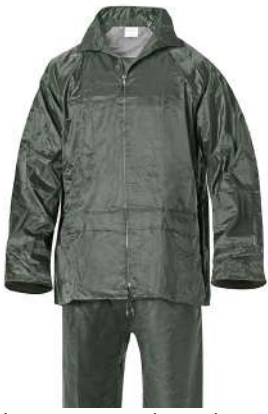
Traje agua verde nylon

Talla M: CÓD. 15010029 Talla L: CÓD. 15010026 Talla XL: CÓD. 15010027 Talla XXL: CÓD. 15010028