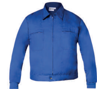
Chaqueta trabajo azul