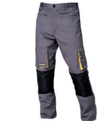
Pantalón trabajo gris y amarillo largo