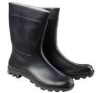
Botas goma bajas negras