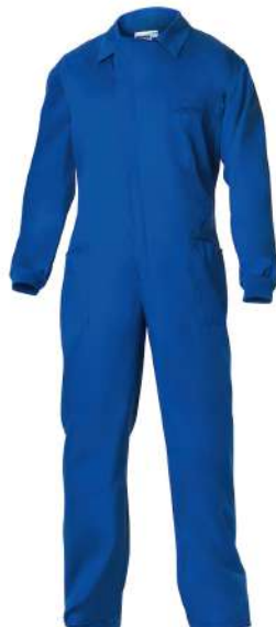
Buzo trabajo azul

Talla 48: CÓD. 15020800 Talla 50: CÓD. 15020805 Talla 52: CÓD. 15020810 Talla 54: CÓD. 15020815 Talla 56: CÓD. 15020820 Talla 58: CÓD. 15020825 Talla 60: CÓD. 15020830 Talla 62: CÓD. 15020835 Talla 64: CÓD. 15020840 Talla 66: CÓD. 15020845