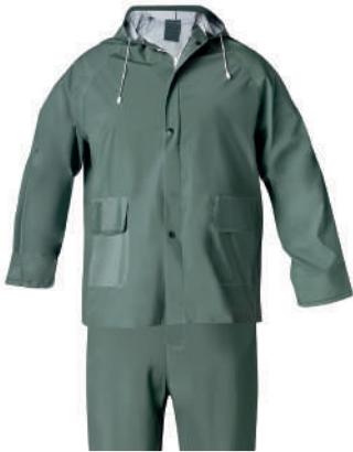
Traje agua verde P.V.C.

Talla M: CÓD. 15010006 Talla L: CÓD. 15010007