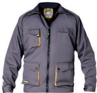
Chaqueta trabajo gris y amarillo