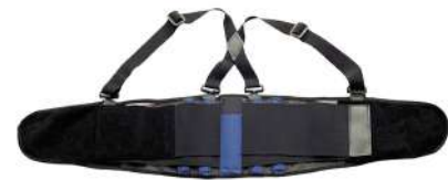
Faja lumbar con tirantes

Talla S-M: CÓD. 15030110 Talla L-XL: CÓD. 15030115