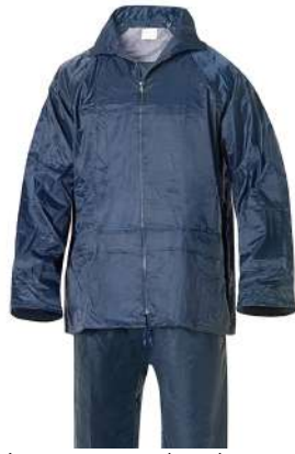
Traje agua azul nylon

Talla M: CÓD. 15010014 Talla L: CÓD. 15010015 Talla XL: CÓD. 15010020 Talla XXL: CÓD. 15010025