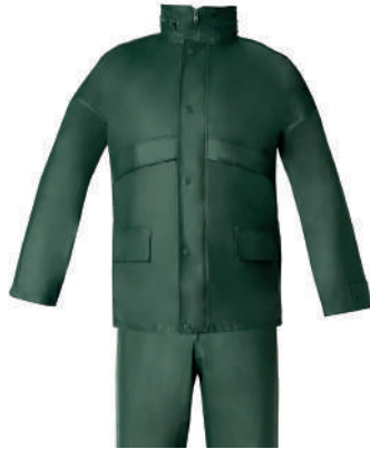
Traje agua verde poliuretano

Talla L: CÓD. 15010037 Talla XL: CÓD. 15010038 Talla XXL: CÓD. 15010039