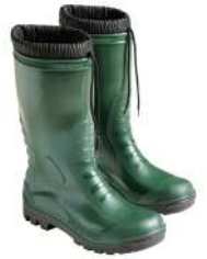
Botas goma altas verdes invierno 80