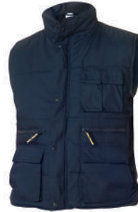
Chaleco multibolsillos azul