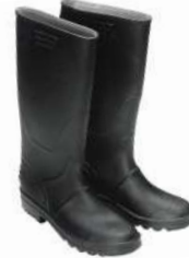
Botas goma altas negras